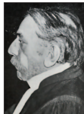
Jules Destrée: "Sire, er bestaan geen Belgen" (1912)