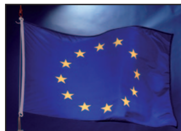
Besluitvorming democratisch maken

Het Europa dat we nu kennen is verre van democratisch. Veel zaken worden nog beslist buiten het EU-parlement om. Er is geen duidelijk, homogeen en rechtlijnig model van bevoegdheden in de EU (net zo min als voor België). Daarom kan de EU in het dagelijks leven van de Hoeilander tussenkomen zonder dat dit door een parlement gezien werd. De N-VA staat voor meer democratie en transparantie op ieder niveau en dus ook die van de EU.