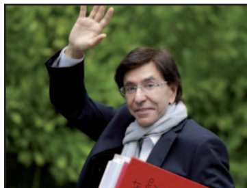
PS kreeg 53 % van onderhandelingsstijd, de N-VA 16 %.

België is nooit echt een federaal land geweest. Op geen enkel vlak heeft een deelstaat de volle bevoegdheid. De Vlaamse meerderheid kan niets beslissen zonder de goedkeuring van voornamelijk de PS, wat zich ook heeft laten voelen in het beleid (belastingen) van de paarse regeringen en de actuele regering. De traditionele Vlaamse partijen zijn gezwicht voor de PS met desastreuze gevolgen op sociaal, economisch, politiek en juridisch vlak. Deze partijen hebben voor de macht geopteerd, terwijl de N-VA voor de Vlamingen opkomt.